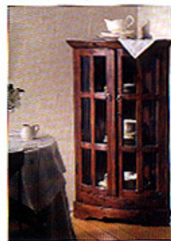
6 Curso de decoración

Rentabiliza una esquina de tu comedor con un mueble rincónero; mejor si tiene el frente curvo, como éste de la imagen, porque así no dificulta el paso. Recuerda que debe tener un fondo de 40 cm si lo destinas para guardar la vajilla, de manera que puedas apilar los platos con desahogo. En las tiendas verás también distintos modelos de alacenas esquineras, que tienen la parte de abajo cerrada, y la de arriba, con puertas de cristal.