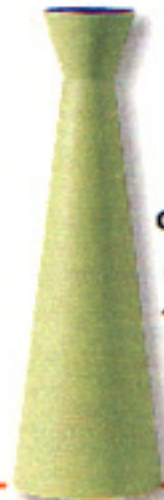
◀ CÓNICO Jarrón de Bo Concept. Es de loza. Tiene 35 cm de altura y la base mide 11 cm. Su precio es de 3845 ptas.