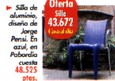
► Silla de aluminio, diseño de Jorge Pensi. En azul, en Pabordia cuesta 48.525 ptas.