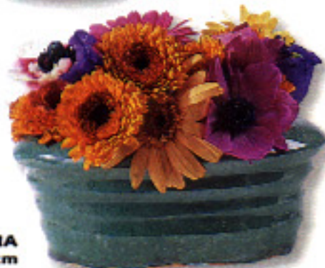
▶ OVALADO. Macetero de cerámica. 8 x 7,5 cm. En Cia. Z Importadora, 2.475 ptas.