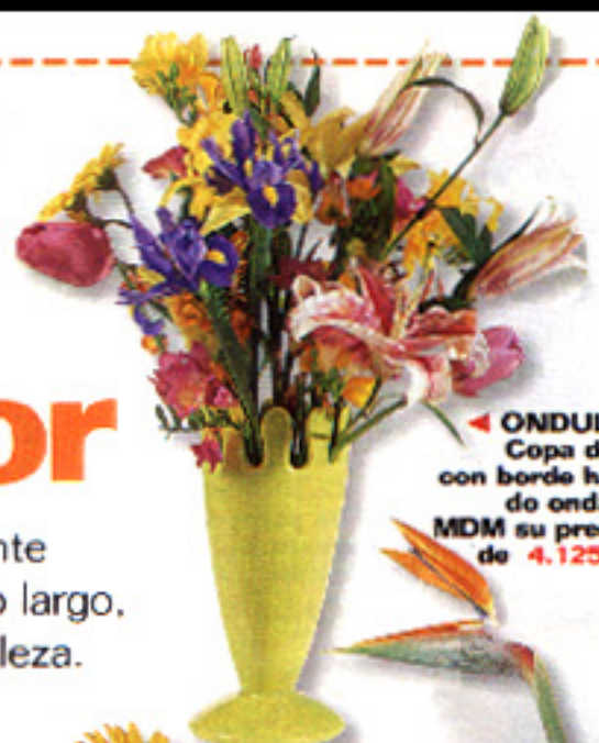
◀ ONDULADO Copa de loza con borde haciendo ondas. En MDM su precio es de 4.125 ptas.

Realización: Nuria Menoyo.