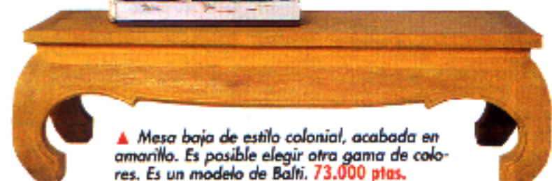
▲ Mesa baja de estilo colonial, acabada en amarillo. Es posible elegir otra gama de colores. Es un modelo de Balti. 73.000 ptas.