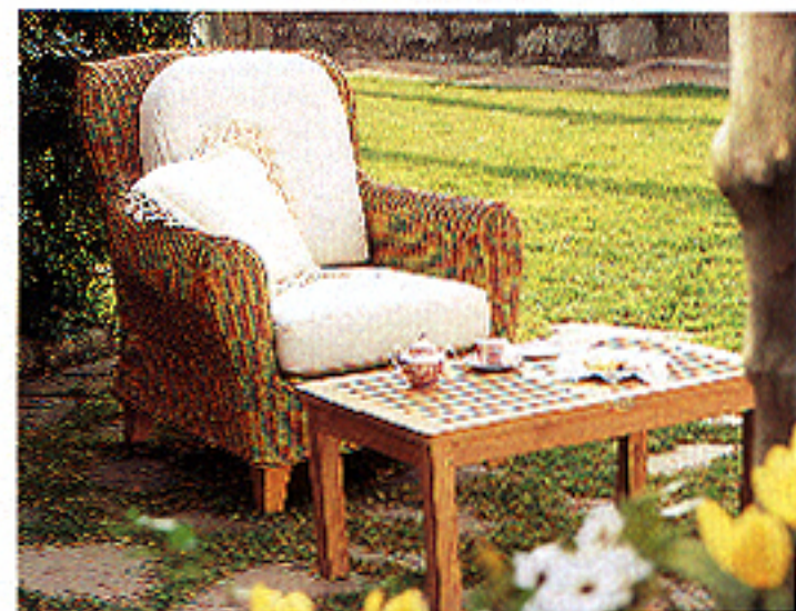
Sillón de rattan, 80.000, y mesa de teca, 34.000 ptes. Greendesign.

La teca es una de las maderas más utilizadas para muebles de exterior. Sus características la avalan: es incorruptible, resiste al ataque de los insectos y su mantenimiento es sencillo, no siendo necesario ningún cuidado especial para su conservación. Su coloración rojiza es especialmente atractiva en espacios verdes, por lo que ha sido adoptada como material estrella de este tipo de mobiliario.