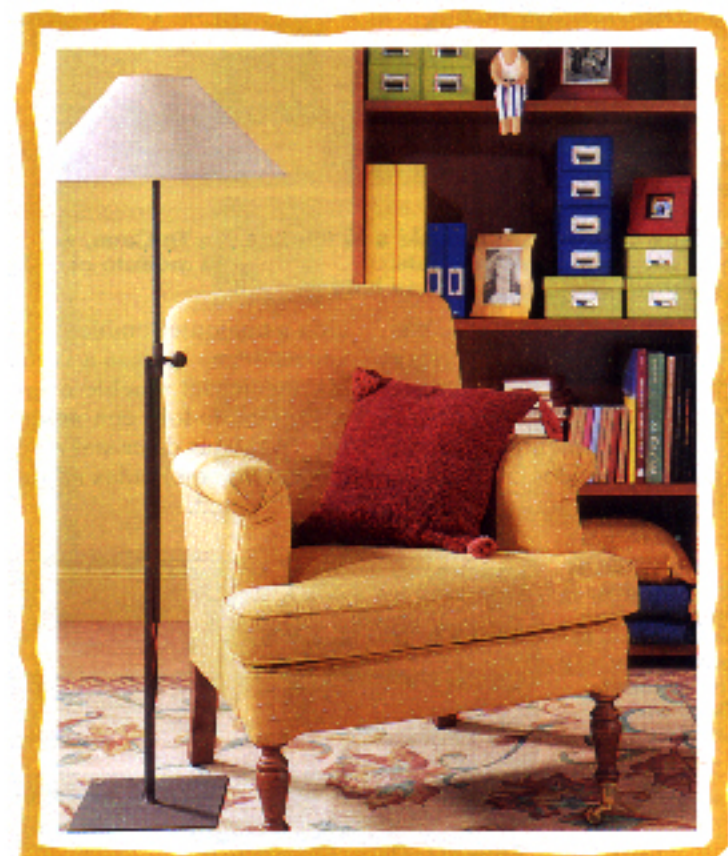
DE FORJA. Lámpara con pantalla de loneta y pie regulable de Tost. 23.780 ptas. En Lámparas Oliva. La butaca Vicky es de Cristalcolor y la alfombra, de Musgo.