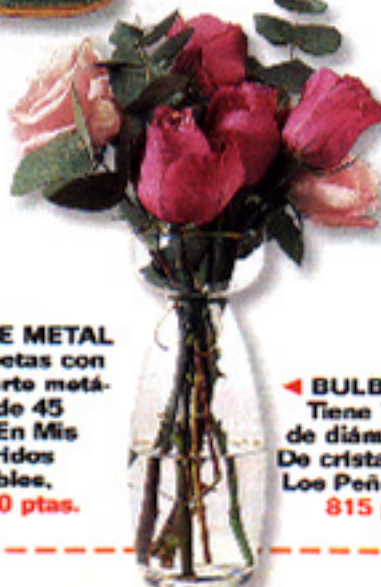
▶ BULBERA Tiene 7 cm de diámetro. De cristal, en Los Peñotes, 815 ptas.