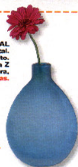
▶ MATE Botella de vidrio mateado. En Habitat, 4.270 ptas.