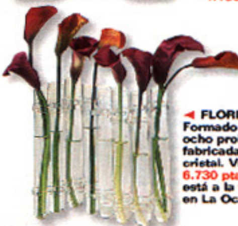
◀ FLORERO Formado por ocho probetas fabricadas en cristal. Vale 6.730 ptas., y está a la venta en La Oca.