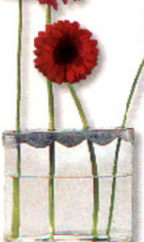
◀ CUBETA. Con tapa metálica para sujetar los tallos de las gerberas. En Los Peñotes cuesta 1.880 ptas.