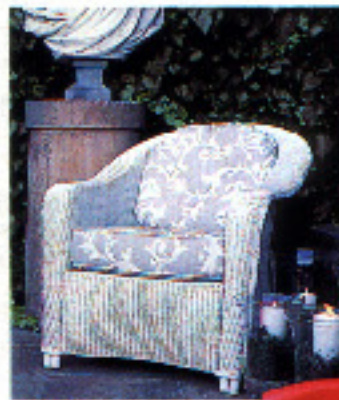
Sillón de Kettal. En Deco-Jardín y Terraza, 96.000 ptas.