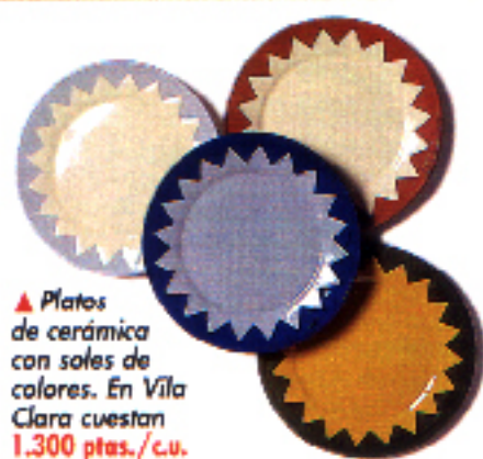
▲ Platos de cerámica con sales de colores. En Vila Clara cuestan 1.300 ptas./cu.