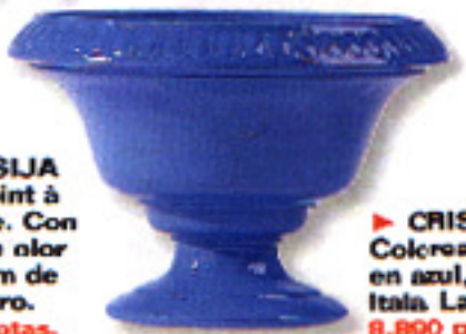
▶ CRISTAL Coloreado en azul, de Itala. La Oca, 8.800 ptas.