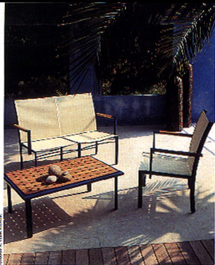
Mesa de madera y aluminio lacado, 106.500 ptes. Sillón y sofá, 74.900 y 132.900. De Sauvagnat, a la venta en Cadena Flores.

resina reciclable, la madera tratada, la lana, el mimbre o la médula de ratón combinado con hierro forjado. En las nuevas colecciones de muebles de terrazo se emplean telas y texturas ligeras, que evitan una posible sensación de pesadez en los ambientes exteriores. En algunos casos, es el diseño el encargado de simplificar el espacio. Por ejemplo, han reaparecido las típicas mesas de bar de aluminio, poco pesadas y muy fáciles de trasladar; a las clásicas hamacas de los buques de recreo, que también han cambiado muy poco, aunque ahora se fabrican con lanas más suaves y estampadas