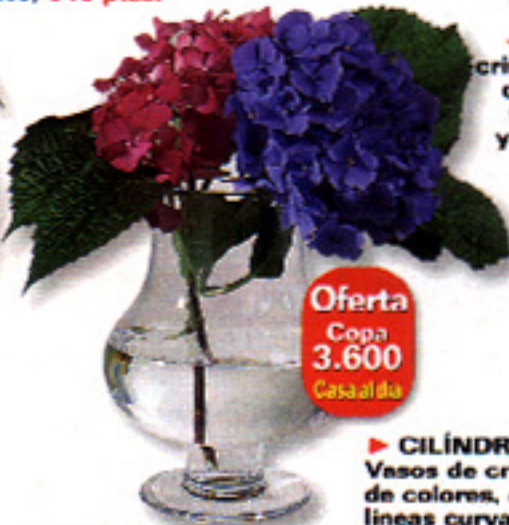
Oferta Copa 3.600 Casa al día