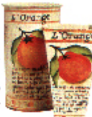
▲ Jarrones de Capdevila Decoració. 4.700 ptas./cu.

◆ Ilermueble. Esta firma dispone de tres tiendas especializadas en mobiliario rústico,