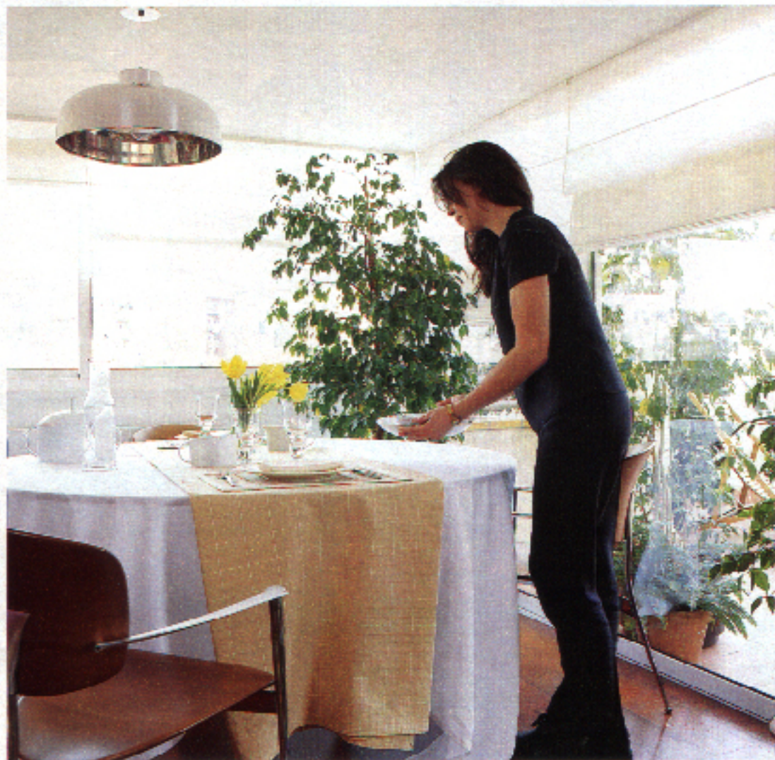
En el comedor, la vajilla de Gallery House se ha colocado sobre un camino de mosaico.

✓ ACCESORIOS MÁS PRACTICOS: en los frentes de la cocina, cubiertos con planchas de acero, se ha instalado una barra para dejar utensilios y estantes metálicos. Los tiradores horizontales en los cajones facilitan mucho su apertura y a la vez sirven para colgar paños de cocina.