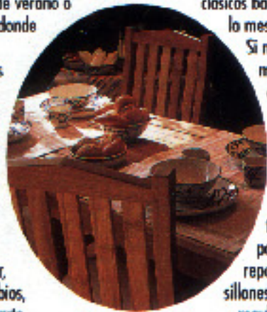
De Inthai, mesa y silla de teca. 418.000 y 88.000 ptas. A la venta en Coda.

Actualmente existen materiales que permiten diseños mucho más flexibles que antes y son muy agradecidos a la hora de decorar. Es el caso del acero lacado en diferentes colores, la