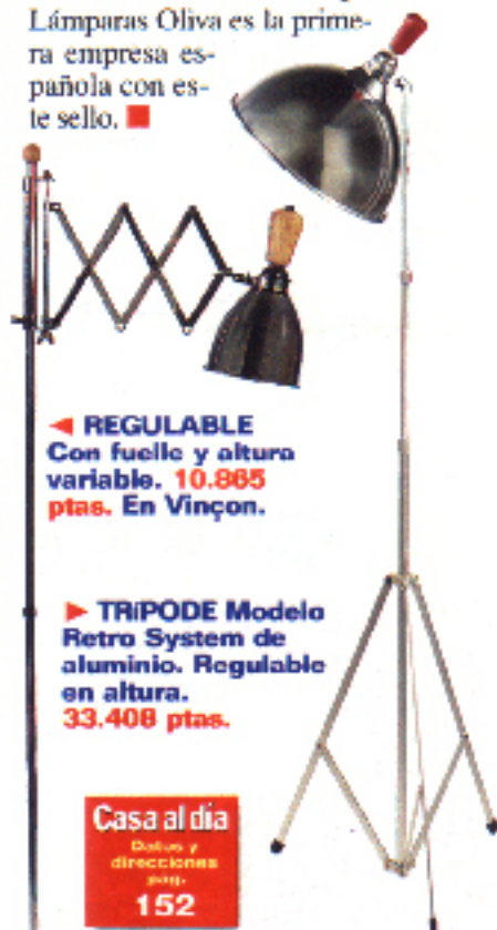
◀ REGULABLE Con fuelle y altura variable. 10.865 ptas. En Vinçon.

agradables. En el comedor, los modelos de techo regulables en altura o de contrapeso son los más prácticos para dar luz puntual, sobre todo en la zona del office. Las luminarias móviles son recomendables en zonas de estudio, en concreto las que tienen pantallas metálicas, ya que concentran más la luz, y los flexos dirigibles. Para reconocer la calidad de una lámpara existen dos certificados europeos de control: AENOR e IQNet. Lámparas Oliva es la primera empresa española con este sello. ■