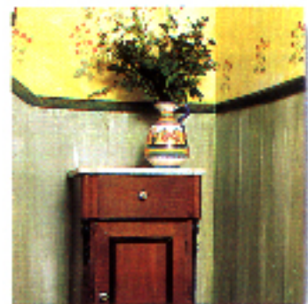
▲ Mesilla de nogal. A la venta en L'Arca. 55.000 ptas.

◆ Draps de Casa. Ropa para el hogar, mobiliario auxiliar en hierro forjado, objetos de decoración... Pero es su gama de tapicerías para sofás y sus telas para confeccio-