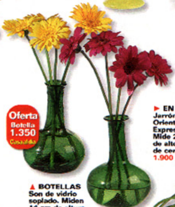
Oferta Botella 1.350 Casa al día