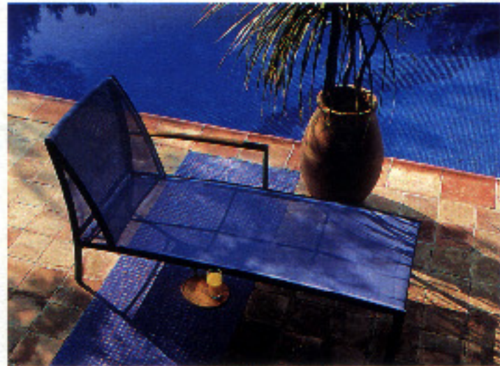
Tumbona de Sauvagnat, de la colección Triconfort, con apoyabrazos y soporte para la bebida. 132.000 ptas. en Mesdag Muebles.