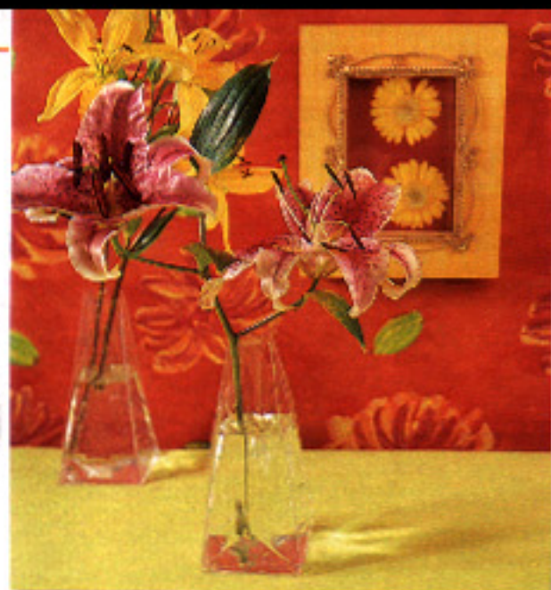
▶ EN PLÁSTICO. Jarrones plegables. Tienen 20 cm de altura. En Antennae, 550 ptas./c.u.