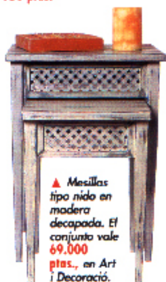
▲ Mesillas tipo nido en madera decapada. El conjunto vale 69.000 ptas., en Art i Decoració.