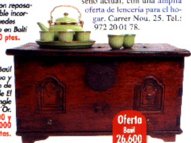
◀ Sillón con reposapiés extraíble incorporado. Puedes encontrarlo en Balti por 64.600 ptas.

◆ Vila Clara. Modelos exclusivos, y muy atractivos, en cerámica decorativa y menaje de mesa. Su amplia selección de diseños y colores sin duda te hará volver más de una vez. Visítalos en Sis d'Octubre, 27. La Bisbal de l'Empordà. Tel.: 972 64 25 79. ■