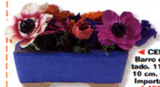
◀ CENTRO Barro esmaltado. 11 cm x 10 cm. Cia. Z Importadora, 1.150 ptas.