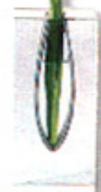
▶ VIOLETERO Diseño con pinza metálica. Es de Parlane. En La Oca, 3.650 ptas.