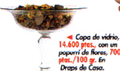
▲ Copa de vidrio, 14.600 ptas., con un popurrí de flores, 700 ptas./100 gr. En Draps de Casa.