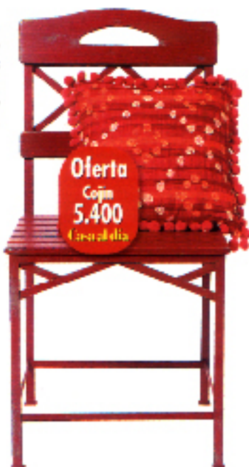
Oferta Cojín 5.400 Casadía