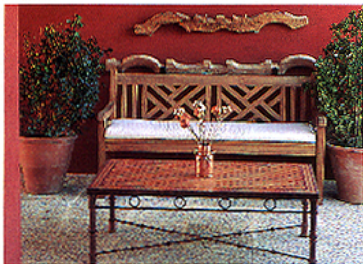
Mesa con tablero de mosaico y patas de forja, 109.000 ptes. Banco en madera de teca, 87.000. Se vende en Greendesign.