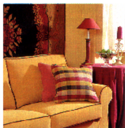
▲ En Draps de Casa vimos este sofá, 262.400 ptas., y la lamparita de pie, que vale 8.010 ptas.