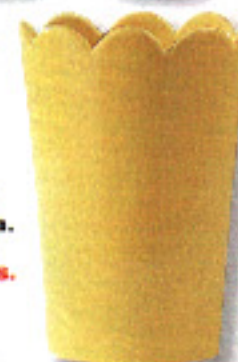
▶ CON FESTÓN Jarra de porcelana. 25 cm de alto. C' Inglesa, 2.520 ptas.