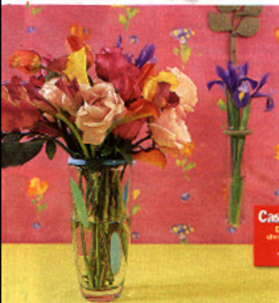
▶ PINTADO. Jarrón de cristal con hojas pintadas. 25 cm de alto y 15 cm de diámetro. Habitat, 4.270 ptas.