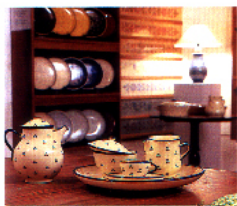
▲ Juego de café de Vila Clara. El juego de seis servicios, con bandeja, 18.840 ptas.