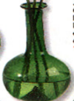
▶ BOTELLAS Son de vidrio soplado. Miden 14 cm de altura. En Oriente Express, 1.500 ptas./c.u.