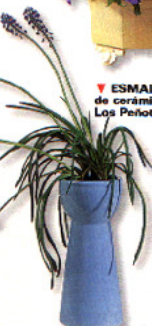
▶ ESMALTADA. Bulbera de cerámica azul. En Los Peñotes, 515 ptas.