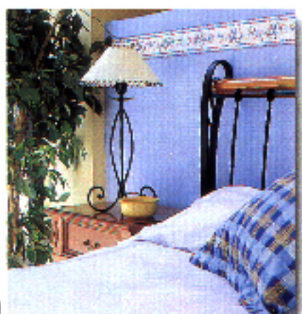
▲ En Ilermueble, cabecero de hierro forjado, 58.000 ptas., y lámpara, 16.000 ptas.