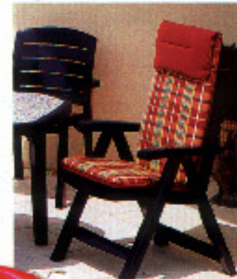
Sillón de Grasfillex, en El Corte Inglés, 11.665 ptas.