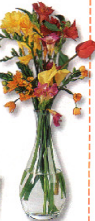
▶ DECANTADOR Recipiente como los que se utilizan en los laboratorios. Vinçon, 1.650 ptas.