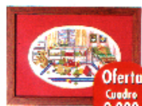
▲ Cuadro de punto de cruz, enmarcado. En La Caseta des Fils cuesta 10.000 ptas.