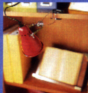
▲ Lámpara de pinza Fas. En Ikea, 1.975 ptas.