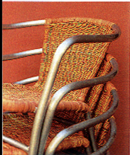
Mod. Ayres de Habitat. Son de ratón y acero. 10.900 ptes./c.u.