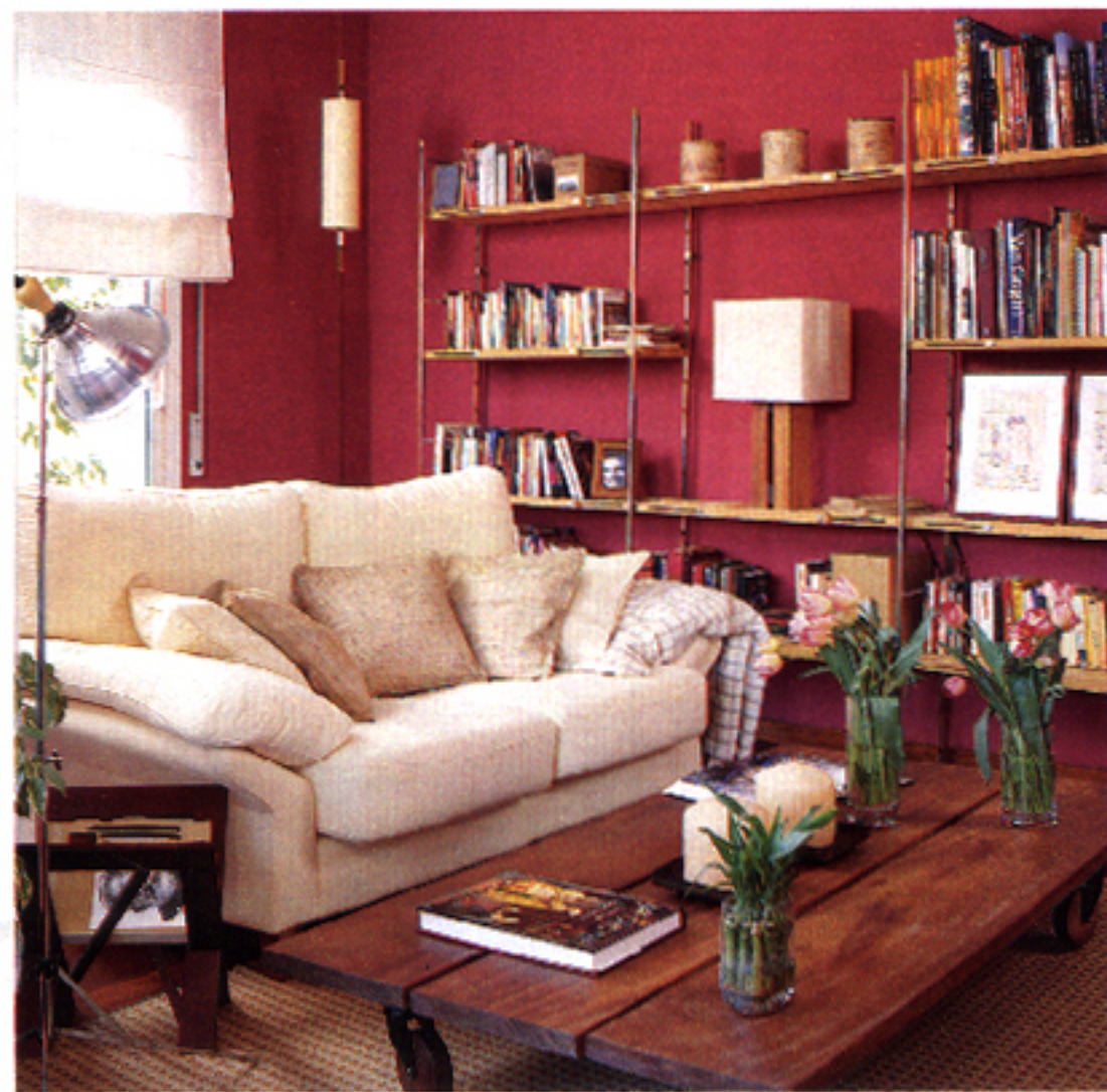
Mesa de centro Bero-b y estantería extensible Eoex, ambas compradas en Santa & Cole.

✓ DIFUSA: junto a la librería, una lámpara cilíndrica con mecanismo de sube y baja da un punto de luz al rincón más oscuro. La lámpara de sobremesa da una iluminación más cálida y difusa a la estantería.