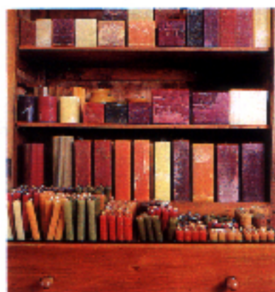
◀ Cerería Karla vende velas de colores entre 145 y 950 ptas.