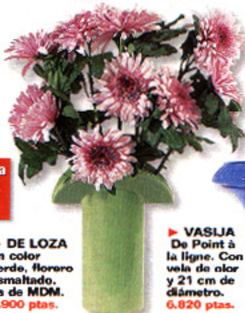
▶ DE LOZA En color verde, florero esmaltado. Es de MDM, 1.900 ptas.