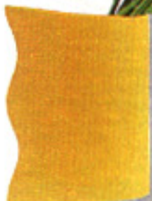
▶ DE DISEÑO Jarrón de loza esmaltado en amarillo. MDM, 1.800 ptas.