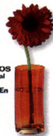
▶ CILÍNDRICOS Vasos de cristal de colores, de líneas curvas. En La Oca valen 900 ptas./c.u.