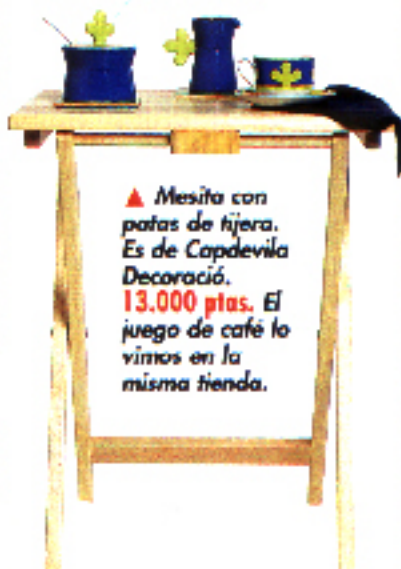
▲ Mesita con patas de hieira. Es de Capdevila Decoració. 13.000 ptas. El juego de café lo vimos en la misma tienda.

◆ Papiro. Mueble rústico auxiliar y objetos de regalo ocupan la planta baja de este local. El piso superior está dedicado a la papelería ecológica y reciclada: material de correspondencia, agendas, álbumes... En Major, 58. Tel.: 973 22 30 52. ■