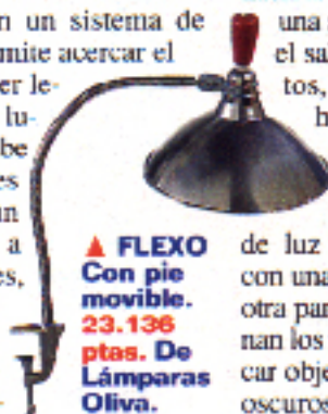
▲ FLEXO Con pie móvil. 23.136 ptas. De Lámparas Oliva.

tanterías o rincones de trabajo. Todas estas propuestas ofrecen diversas posibilidades de iluminación. Por ejemplo, para lograr una agradable luz general en el salón, sin deslumbramientos, dirige una luz potente hacia el techo. Para ello puedes utilizar una lámpara de pie regulable, que emita un haz de luz abierto y difuminado, con una bombilla halógena. Por otra parte, la luz que proporcionan los focos te ayudará a destacar objetos, muebles o rincones oscuros, creando climas muy