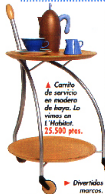
▲ Carrito de servicio en madera de haya. Lo vimos en L'Habitat. 25.500 ptas.